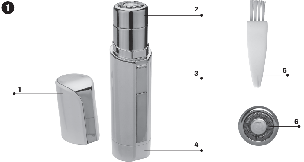
Abbildung | Illustration | Figure | Figura | Afbeelding | Álbra | Obrázek | Obrázok | Figura | Rysunek | Resim | Figura