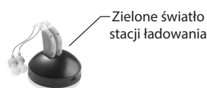
Szybka ładowarka MSA 30X