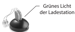
MSA 30X Schnellladegerät