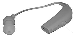
Silikonowe zatyczki do uszu