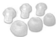
12 embouts réglables en silicone