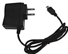
Adaptateur pour recharger le MSA 30X