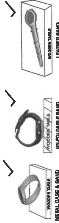
WOODEN TABLE METAL CASE & BAND

Bei Metallgehäusen mit Metallbanduhr sollte das Uhrenband, wie unten gezeigt, vom Uhrengehäuse entfernt sein (legen Sie die Zündholzschnachtel zwischen Gehäuseboden und Metallband ein), da dies den Empfang beeinträchtigt.