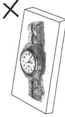
Never let the metal band touch the case back as it will effect the signal reception

-Legen Sie die Uhr niemals an die Seite, da sie in dieser Position kein Signal empfangen kann.